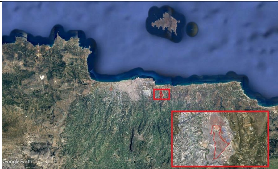
Εικόνα 1: Θέση του έργου και μεγέθυνση στην ένθετη εικόνα.

με ενδεικτικές συντεταγμένες της ιδιοκτησίας σε ΕΓΣΑ 87,