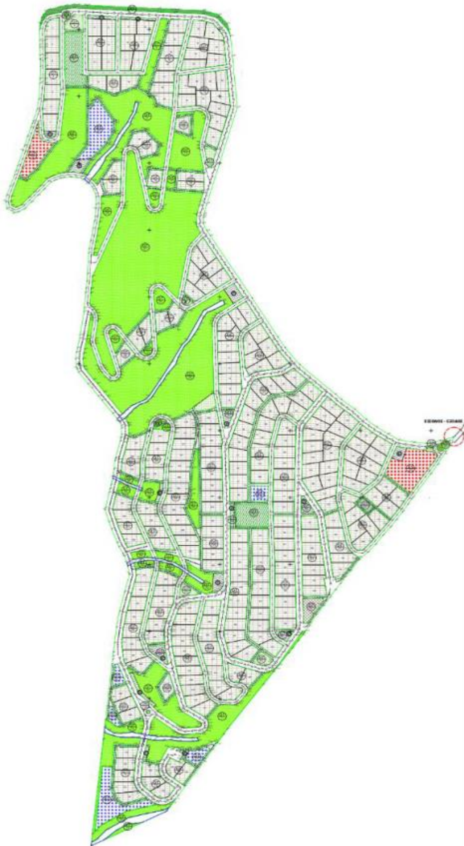
Εικόνα 3: Σχηματική απεικόνιση των φυτεύσεων