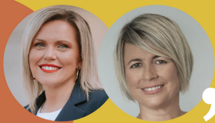
Ροδάρω στη Ζωή...και στα δικαιώματά μου Γεωργία Μηλάκη Αντιπεριφερειάρχη Πολιτισμού και Ισότητας Περιφέρειας Κρήτης Αικατερίνη Πατσογιάννη Γενική Γραμματέα Ισότητας και Ανθρωπίνων Δικαιωμάτων