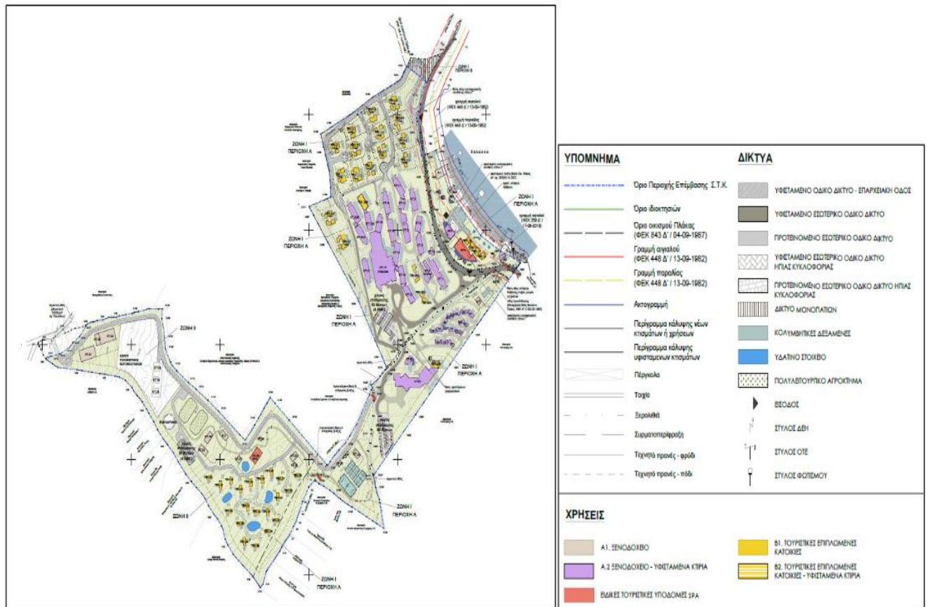
Προτεινόμενη εσωτερική οργάνωση του έργου (Masterplan)

Προβλέπεται να κατεδαφιστούν τμήματα τεσσάρων κτιριακών εγκαταστάσεων. Η συνολική κάλυψη των καθαιρέσεων είναι 698,82 τμ, η συνολική δόμηση 1.065,59 τμ και ο συνολικός όγκος 4.472,21 τ.μ.