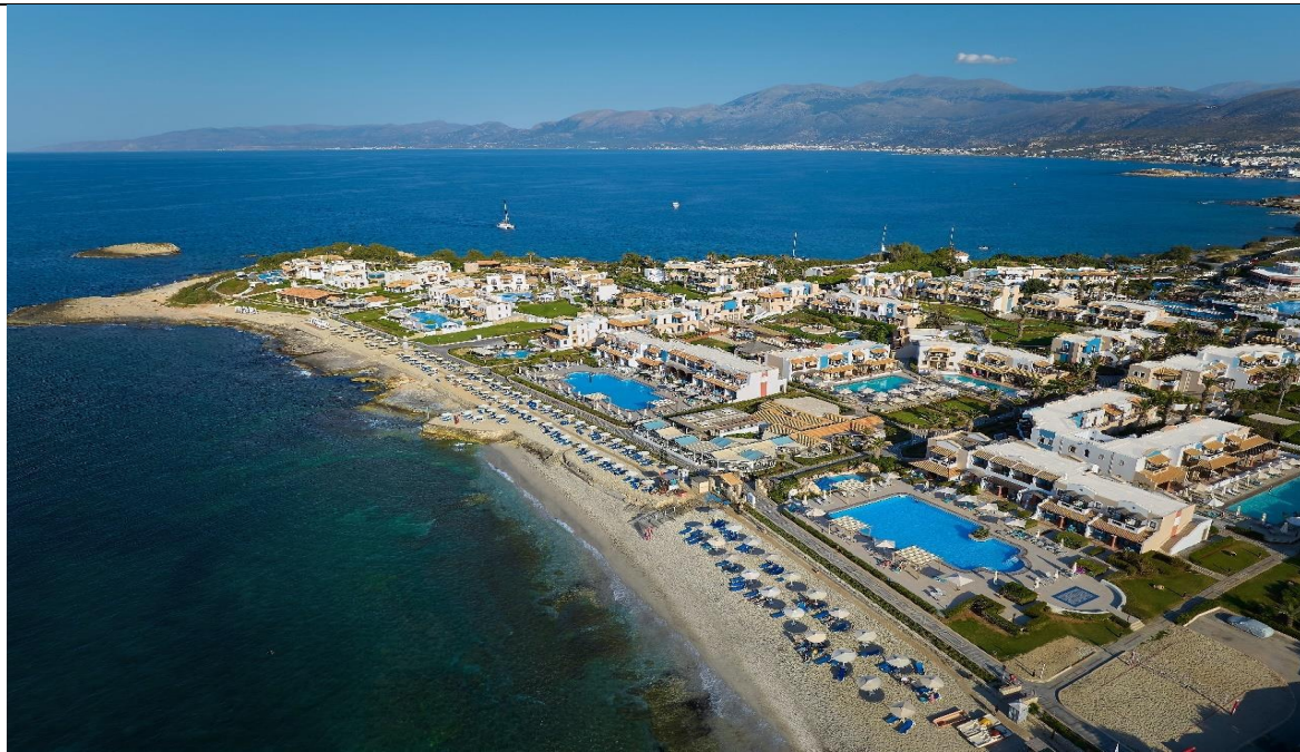
Πανοραμική λήψη του ξενοδοχείου