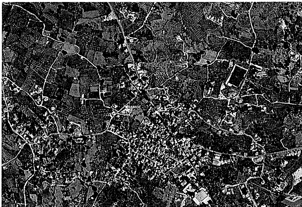
Αεροφωτογραφία 1: Θέση χώρου παρεμβάσεων

Συνοπτικά το έργο στο σύνολό του θα περιλαμβάνει τα εξής: