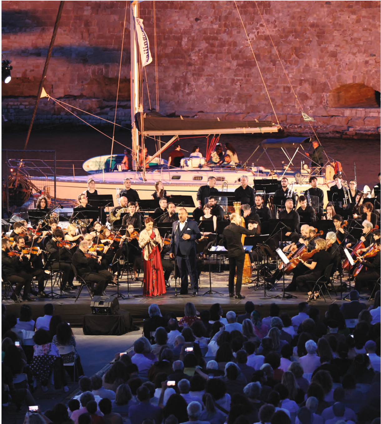
Έναρξη του 3 ου Φεστιβάλ Κρήτης "Τιμώντας τη Μαρία Κάλλας"