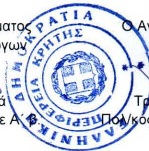
Τριαματάκη Χαρά Πολ/κός Μηχανικός με Α' β.